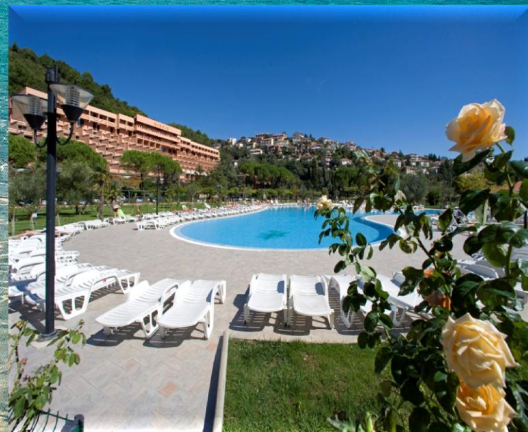
sastaju s morem .....