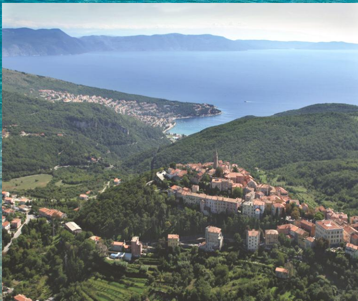
Mjesto gdje se brežuljci